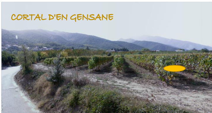
CORTAL D'EN GENSANE

Lotissement bénéficiant d'une vue REMARQUABLE ... Il est composé de 16 parcelles uniquement en 4 FACES , toutes exposées plein SUD et bénéficiant également d'une alimentation en eau d'arrosage sous pression .